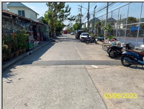
ถนนและทางเท้า