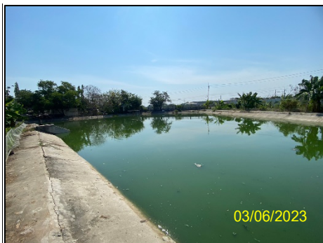
บ่อหนองน้ำฝน