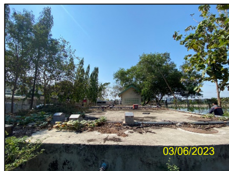
บ่อบำบัดน้ำเสีย