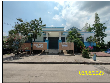
ศูนย์ชุมชน