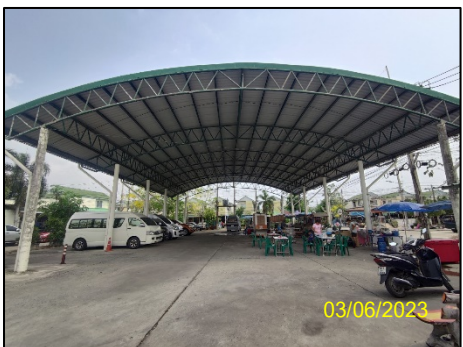
ลานร้านค้าชุมชน