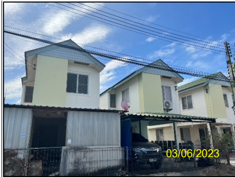
ลักษณะหน่วยพักอาศัย