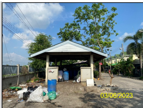
ที่พักขยะ